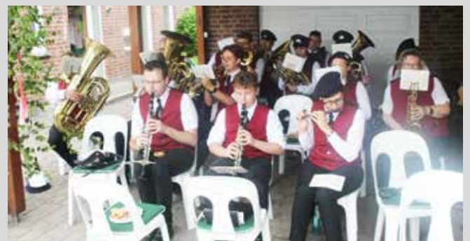
↑ Stadt- und Feuerwehrkapelle Sendenhorst, die seit Jahrzehnten beim Schützenfest am Montag begleitet.