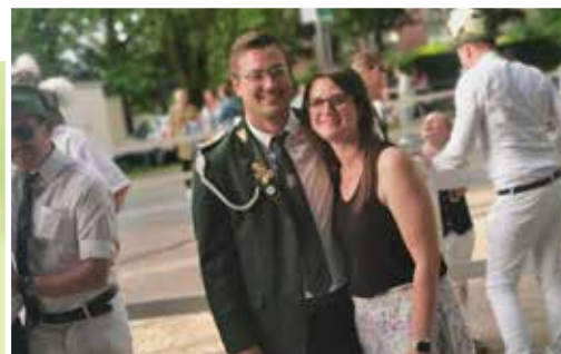
↑Frisch gebackenes Königspaar

In diesem Jahr gibt es einige Änderungen im Festablauf. So wird am Donnerstag der König nebst Hofstaat erstmals am Haus Siekmann abgeholt. Das Holzschuhschießen wurde aus dem Programm gestrichen. Aufgrund der Umbaumaßnahmen in der St. Martin Kirche findet der ökumenische Gottesdienst im Festzelt statt. Auch die Marschrouten weichen aufgrund von Baustellen von denen der letzten Jahre ab.