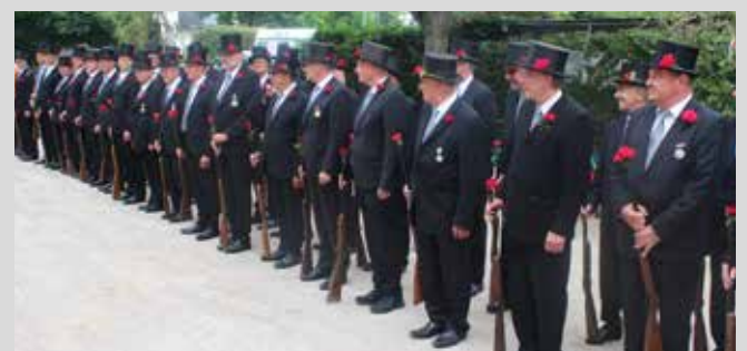
↑ Antreten beim Schützenfest vor dem Haus Siekmann „nach dem ersten Frühstück“