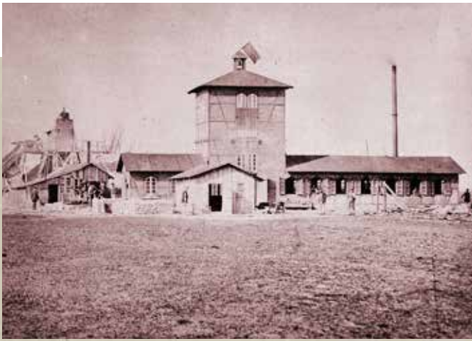
↑ Förderanlage der Grube Bertha, um 1900