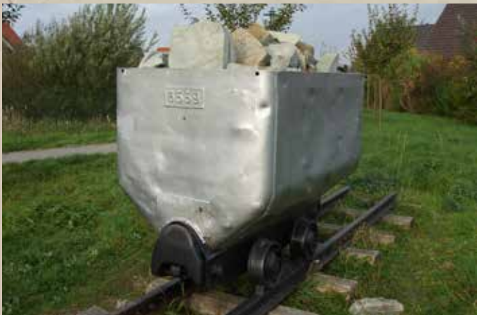
↑ Lore auf dem Strontianit-Lahrfpad

Literatur: Werner Bockholt: Eine Stadtgeschichte 1994; Martin Gesing: Der Strontianitbergbau im Münsterland, Warendorf 1995; Martin Börnchen: Strontianit, Universitätsbibliothek der Freien Universität Berlin 2005 Text: Manfred und Ursula Blanke