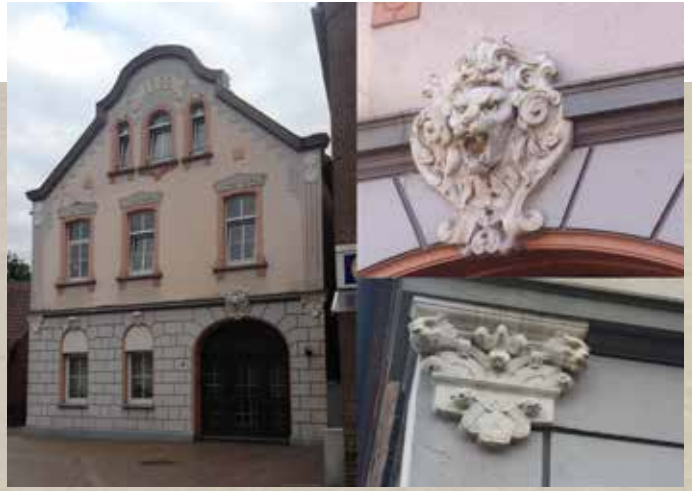
↑ Villa Klapdor, Markt, mit Fassadendetails