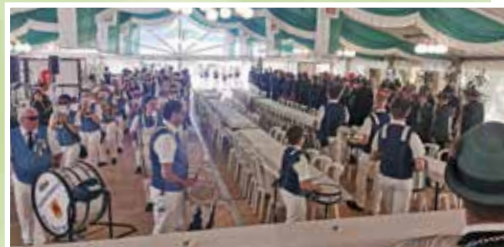
↑Einmarsch ins Zelt