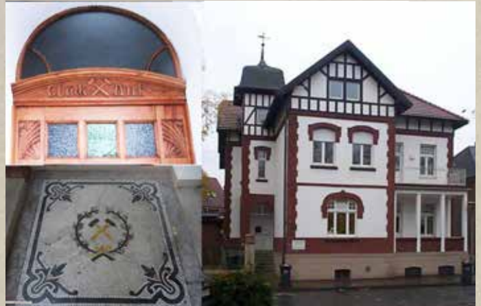
↑ Villa Schmidt, Landsbergplatz, mit Details Haustür und Fußbodenmosaik im Eingangsbereich