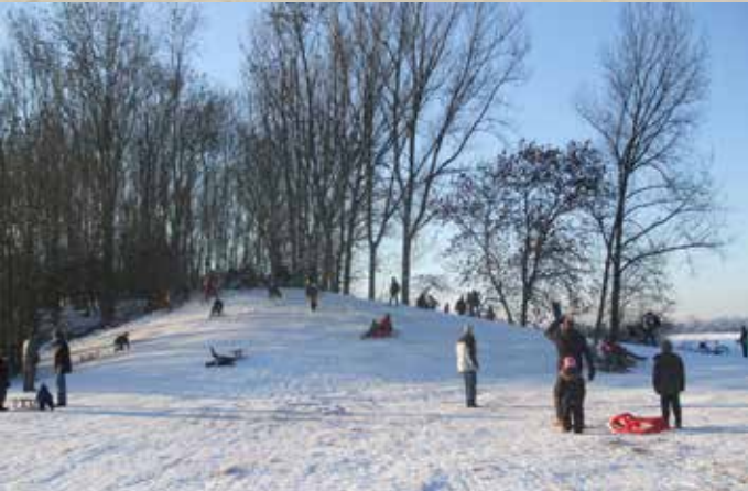
↑ Berthas Halde im Winter