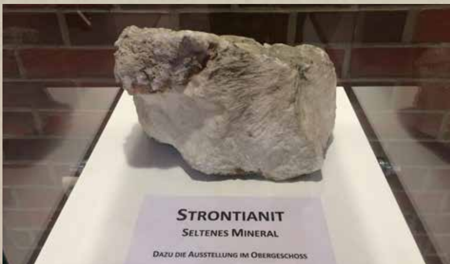
↑ Strontianit, Ausstellung in der Stadtverwaltung Drensteinfurt