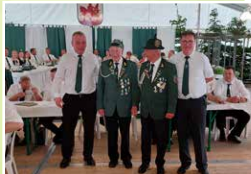
↑Orden 60-Jahre Mitgliedschaft