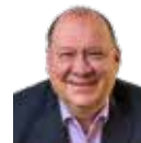
Redaktion Dirk Vollenkemper