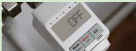
↑ Um Schäden an Wasserleitungen und Gebäuden zu vermeiden, sollte das Heizungsventil nie vollständig zugedreht werden.

Grundsätzlich lauern die Gefahren für einen Leitungswasserschaden dort, wo nur selten oder gar nicht geheizt wird, zum Beispiel in Vorrats- und Abstellräumen oder im Keller. Besonders in leerstehenden Gebäuden und Ferienwohnungen oder -häusern besteht ein erhöhtes Risiko. Heizung, Leitungswasser und Elektrik sollten daher regelmäßig kontrolliert und die Gebäude ausreichend beheizt werden. Der Schaden fällt häufig erst auf, wenn die